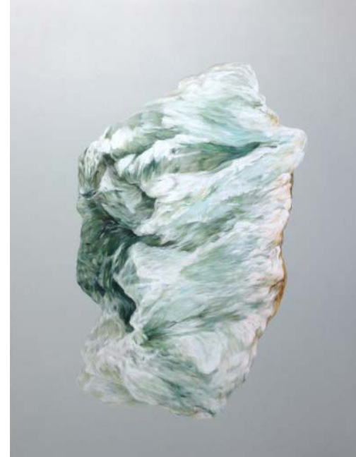
Armelle DE SAINTE MARIE, Olympe, 2016. Acrylique sur toile 162 x 130 cm

L'œuvre d'Armelle de Sainte Marie nous propulse et nous immerge dans un univers où les formes évoquent une géographie imaginaire, presque abstraite. Ce paysage intérieur, onirique et organique se condense sous nos yeux en une forme originelle. Odyssée , le titre de cette œuvre, évoque aussi bien son cheminement personnel que ses propres références littéraires, entre territoires intimes et universels.