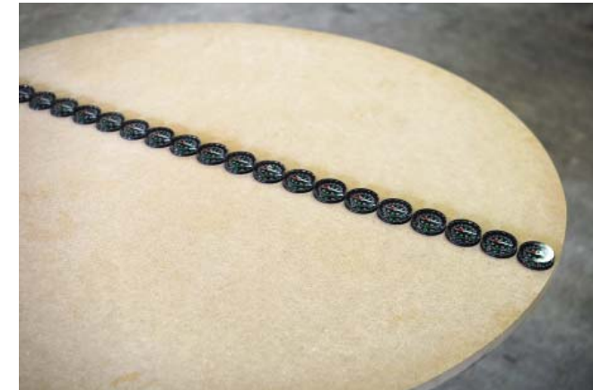
Ahram LEE, turn the table, 2012. Boussoles alignées sur table tournante. Dimesions variables.

L'œuvre de l'artiste coréenne est emprunte de poésie. Le temps, le langage, le hasard, les forces invisibles construisent cet art sensible à son environnement direct. Cette discrète mécanique agit sur ce qui est à peine visible et vient déboussole le spectateur un instant, avant de lui indiquer le nord, la marche à suivre.