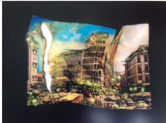
Joana HADJITHOMAS et Khalil JOREIGE, Wonder Beirut #6, Rivoli Square, 1998/2007 Impression lambda montée sur aluminium 70 x 105 cm Collection particulière.

Pour cela ils ont imaginé une fiction dans laquelle un photographe pyromane brûlait une carte postale des années 1960 en temps de paix. La fiction est devenue réalité lorsqu'ils ont mis le feu à cette photographie avant d'immortaliser le résultat par impression.