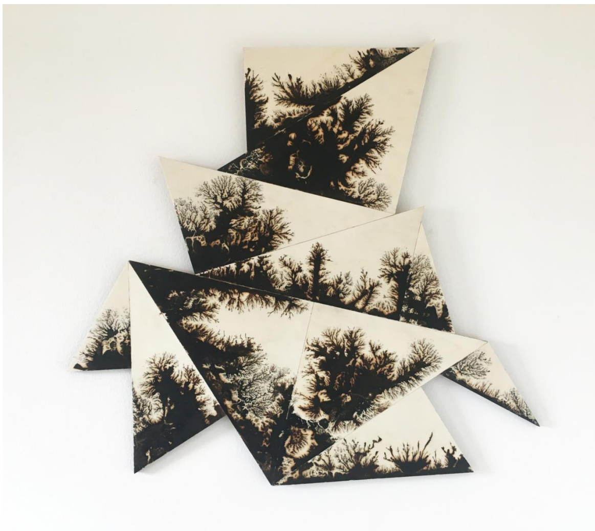
Catherine Burki Déplier le paysage, 2021, 60x80cm, encre, colle, bois. Copyright Catherine Burki

Invité par ARTEUM MAC, l'Atelier Vis-à-Vis, laboratoire de recherche sur l'art visuel, présente en parfaite résonance le travail de Dominique Castell, et une série d'estampes réalisées dans le cadre de ses dernières résidences d'artistes.