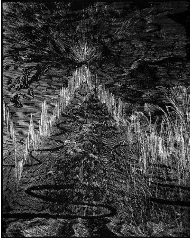
Dominique Castell, Stromboli, sérigraphie sur papier 40x50cm Atelier Vis-à-Vis Éditions, 2021 © Atelier Vis-à-Vis

A l'heure où nous publions, le « pass sanitaire activités » est exigé pour accéder aux lieux de loisirs et de culture rassemblant plus de 50 personnes. » Notre flux de visiteurs est suffisamment étalé dans la journée pour que nous ne dépassions pas ce seuil et une organisation particulière dans le respect des consignes sanitaires est prévue pour le vernissage.