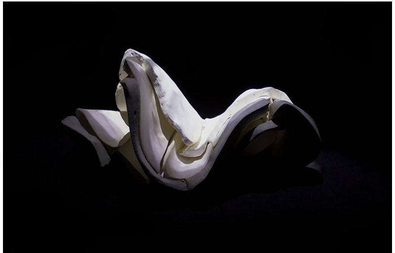
Cette masse de plâtre dévore la peau de cire, pour en assimiler ses courbes et tensions.

« Le toucher est la relation de deux corps qui communiquent leur réalité physique dans l'instant présent. Quelles sont les limites de notre corps, du contact que l'on a avec lui et celui d'autrui? »