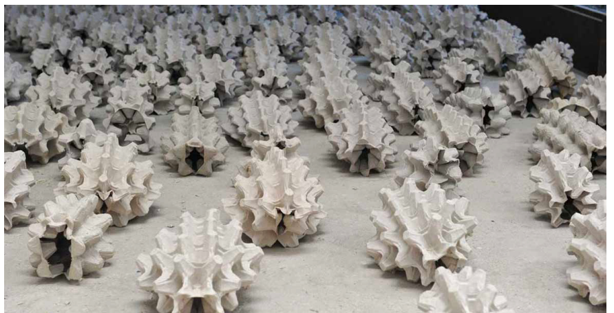
Coquillages - détail.

Nous sommes attirés sur les plages sans trop savoir pourquoi par cet emblème du monde souterrain, de la fécondité et des eaux primordiales. Comme ce qu'il représente dans notre inconscient il ornera nos boîtes à secrets, les miroirs et révélera le flux de notre sang quand on y porte l'oreille.